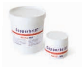
Pâte pour entretien du cuivre "Copperbrill" Copper cleaner "Copperbrill" Pflegepaste für Kupfer "Copperbrill" Pasta para limpiar el cobre "Copperbrill"