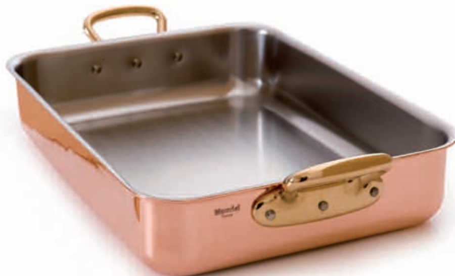
Plaque à rôtir Rectangular roasting pan Rechteckige Bratereine Placa de asar rectangular