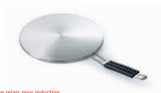
Disque relais pour induction Interface disc for induction cooking Zwischenplatte für Induktionskochen Placa de adaptación para la inducción